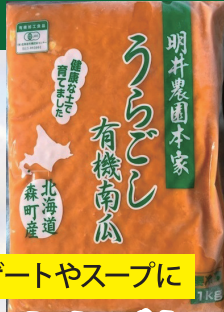
うらごしかぼちゃ