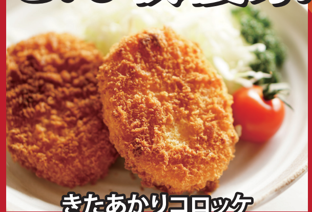
きたあかりコロッケ

北海道産の脂の乗った真ホッケを使用し、食べやすく一口サイズにカットしたフライです。