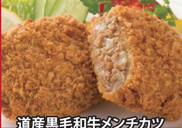
道産黒毛和牛メンチカツ