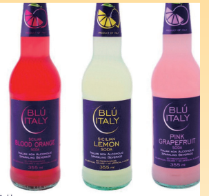
ガルヴァーニーナのイタリアンソーダ「ブルーイタリー」