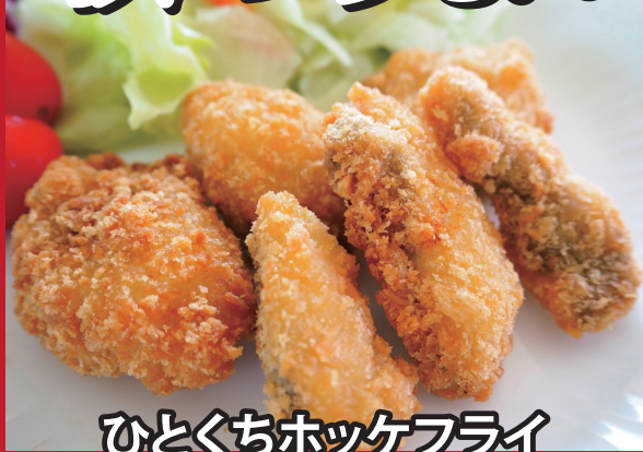
ひとくちホッケフライ