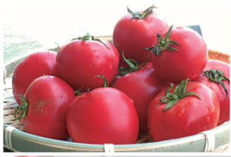
熊本県宇土市 大地のトマト 11月～5月 12個 1,380円 24個 2,640円

ハウスの中に蜂の巣箱を置き、自然に地価環境で育て、徹底的した品質管理を行い年間通して安定的に良質な味のAランクだけのトマトです。