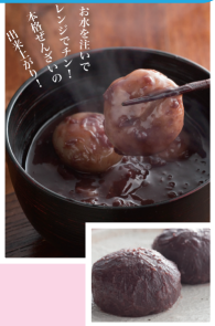
三瀬ぜんざい 1個 100円

佐賀県三瀬村の米を100%使用し、優しい甘さの小倉餡で仕上げた、自然解凍すればぼた餅として、器にぼた餅と水を入れて温めれば「ぜんざい」として手軽に食べられる本格「ぜんざい」です。