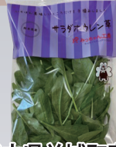
熊本県益城町産 サラダほうれん草 50g 100円

ハウスの中に蜂の巣箱を置き、自然に地価環境で育て、徹底的した品質管理を行い年間通して安定的に良質な味のAランクだけのトマトです。