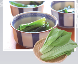
冷凍 広島菜きざみ 1kg 750円

国産の厳選された広島菜を良質の天然水を用いて漬け込んで、使いやすく刻んで冷凍した商品です。